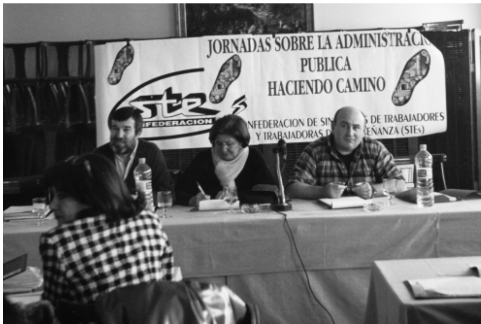
Del 27 al 30 de enero de 2000 Jornadas en Albacete.

creación de intersindicales autonómicas (Canarias, Pays Valencia, Murcia, Andalucía,...) y a la constitución de sectores nuevos, personal laboral y funcionario de la administración Central y Autónoma, Administración Local, mundo rural, Transportes, etc, llegando a ser sindicato mayoritario y representativo en algunas CCAA, haciendo de la Confederación de STEs un proyecto futuro, y ello GRACIAS A TI. Con tu participación, tu voto, tu afiliación, has hecho posible que la voz de los trabajadores y trabajadoras cada vez esté presente en más ámbitos de negociación, y esto es algo que "se les va atragantando", a quienes son incapaces de entender que cada vez somos más quienes no podemos ni queremos que nos representen. Que se vayan acostumbrando a vernos en parcelas